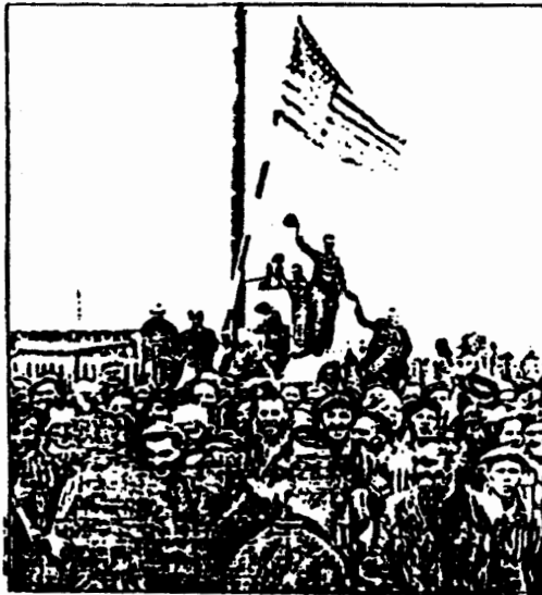
Liberation day at the infamous Dachau concentration camp, Germany 1945.

• Members of the Church of Scientology have been physically attacked, fired from their jobs, excluded from political